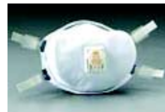
▲ Fig. 15: Respirador do tipo peça semifacial descartável PFF3