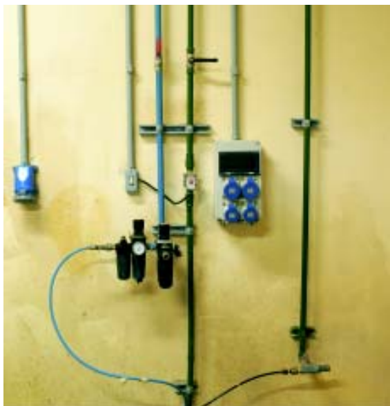
▲ Fig. 8: Instalações elétricas, de linhas de ar pressurizadas e de água

Devem ser utilizados apenas equipamentos, dispositivos e ferramentas elétricas compatíveis com a instalação existente, preservando-se as características de proteção do sistema e a segurança dos usuários.