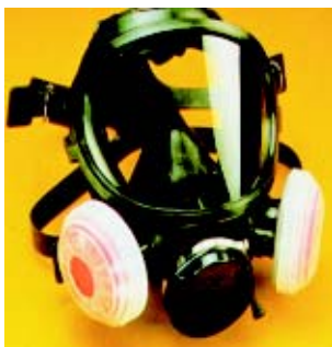
◀ Fig. 13: Respirador do tipo peça facial inteira com filtro P3

2. após a implantação da umidificação e quando o monitoramento da exposição indicar que as concentrações de sílica cristalina presentes na névoa de água formada no processo forem superiores ao nível de ação, correspondente à metade do limite de exposição ocupacional, poderá ser utilizado respirador do tipo peça semifacial com filtro P3 ou um respirador do tipo peça semifacial filtrante do tipo PFF3 (máscara descartável).