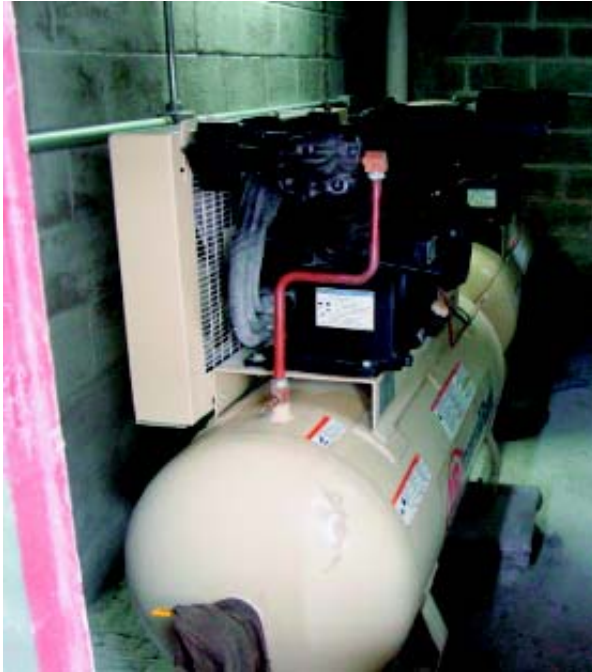
▲ Fig. 5: Compressor isolado e enclausurado