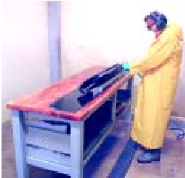
Fig. 11: Escoamento de água por canaletas com grelhas no piso

O piso deve ser regular e favorecer o escoamento da água em direção as canaletas.