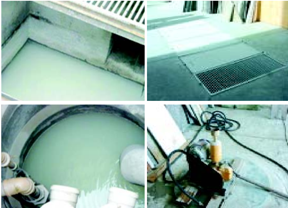
▲ Fig. 12: Partes componentes do sistema de decantação

A água de reuso, quando utilizada no processo, deve apresentar qualidade que não implique risco à saúde dos trabalhadores.