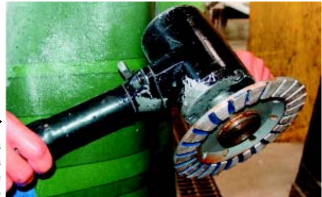
▶ Fig. 7: Lixadeira pneumática com disco de desbaste