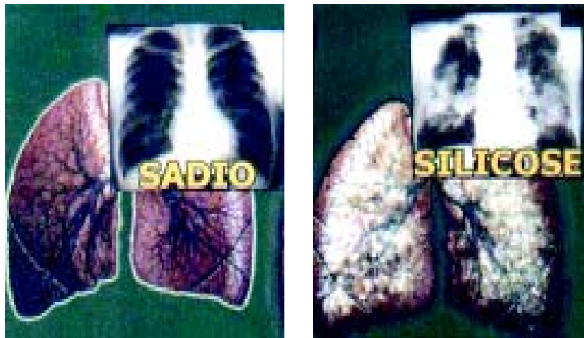
▲ Fig. 2: Pulmão sadio e pulmão com silicose

O desenvolvimento da silicose dependerá da quantidade de poeira contendo sílica existente no local de trabalho e do tempo que o trabalhador fica exposto. No início da doença a maioria dos trabalhadores não sente nada, porém se a exposição à poeira continuar, sintomas como tosse, emagrecimento e falta de ar ao se realizar esforços, podem aparecer rapidamente.