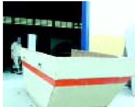
▲ Fig. 17: Recipientes de coleta ▲