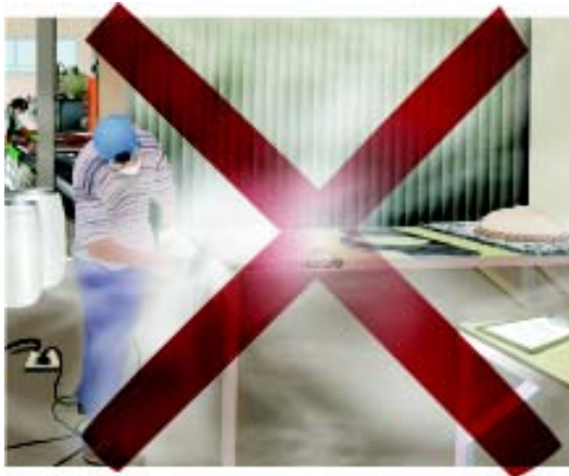
◀ Fig. 3: Situação de acabamento a seco