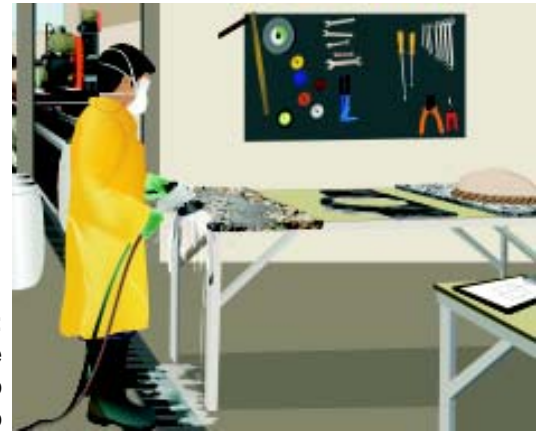
▶ Fig. 4: Situação de acabamento a úmido

Para a implantação da umidificação no processo de acabamento são necessárias adequações nas instalações da marmoraria para a utilização de ferramentas pneumáticas ou elétricas com abastecimento contínuo de água.