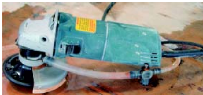
▲ Fig. 9: Lixadeira elétrica com alimentação contínua de água