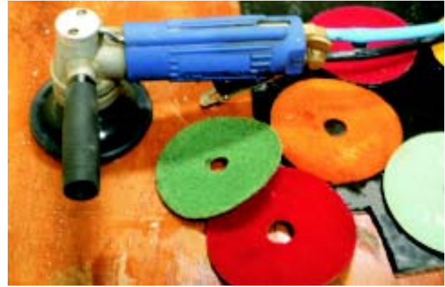
▲ Fig. 6: Lixadeira pneumática e acessórios