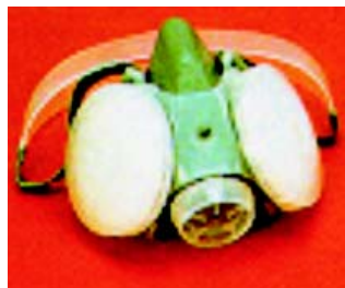
◀ Fig. 14: Respirador do tipo peça semifacial com filtro P3