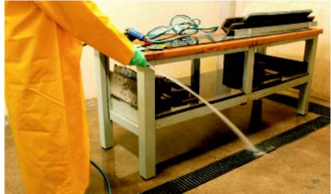
► Fig. 16: Limpeza por lavagem

Lavar o piso, paredes, áreas de trabalho e demais superfícies onde a lama possa ficar acumulada, de maneira a manter o ambiente sempre limpo, impedindo que a lama seque. Caso isso ocorra, ela deve ser molhada antes de ser removida.